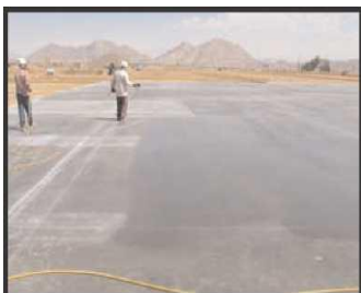
Бетонные полы складских помещений

Благодаря специально разработанному составу средство S-102 по своим характеристикам превосходит все действующие на сегодняшний день требования, применяемые к средствам для влажного ухода за бетоном. Применение средства гарантирует достижение расчетной прочности и получение бетонной поверхности с повышенной степенью износостойкости. Средство рекомендуется применять для ухода за любыми бетонными покрытиями, в том числе: