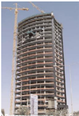
Многоэтажные здания коммерческого назначения

• Экономит время Производственный простой при применении средства не превышает 3-7 дней.